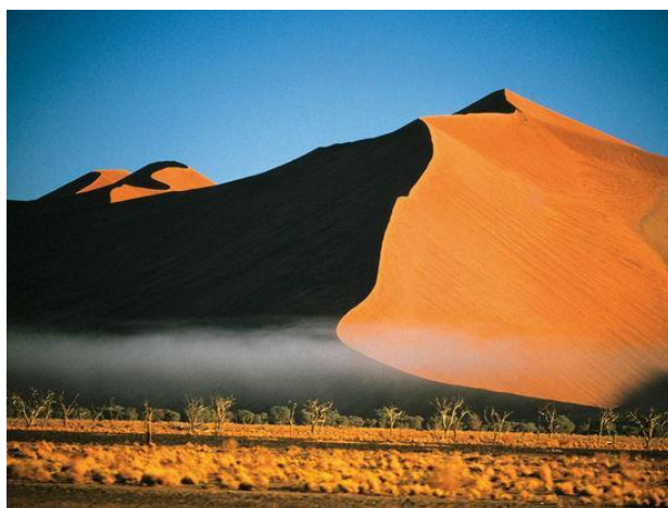
图 3 纳米比亚风景

钻石为纳米比亚最重要的矿产品，产量居世界第六位，原钻或半加工钻石几乎全部出口。铀储量约 28 万吨，占世界储量的 5%，为纳米比亚重要程度排名第二的矿产品。目前产量约占世界产量的 10%，居非洲首位，世界第四位。捕鱼和鱼制品是除矿业外，纳米比亚的另一重要产业，2019 年增长 6.1%，占 GDP 的 2.8%。农业是纳米比亚主要经济支柱产业之一。畜牧业收入占农牧业总收入的 50%以上，以养殖牛、羊为主。