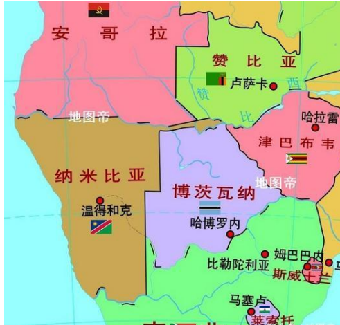
图 1 纳米比亚地图

纳米比亚地处非洲西南部，西濒大西洋，北和东北面与安哥拉、赞比亚毗邻，东邻博茨瓦纳，南毗南非。纳米比亚的国土面积为 82.4 万平方公里，居非洲第 15 位，世界第 34 位。海岸线长约 1600 公里。